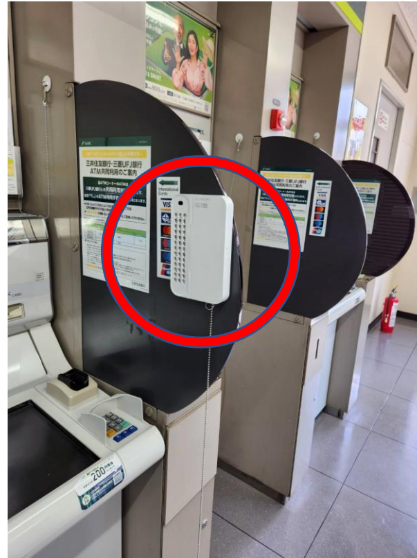
2023年6月1日 三井住友銀行 新富町営業所

警視庁本部、築地警察署、三井住友銀行本社 総務部、コンプライアンス部 担当立ち合いの元、銀行ATMへの設置検証開始（2023年8月末まで3か月間） 現在、銀行としての方向性を策定中。