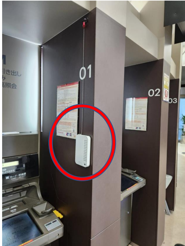
2023年2月1日 三菱UFJ銀行 新富町支店